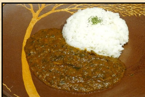
ほうれん草カレー

「カレーに柑橘系？」という方にこそ召し上がっていただきたい後味に絶妙なさわやかさを感じるカレーです。