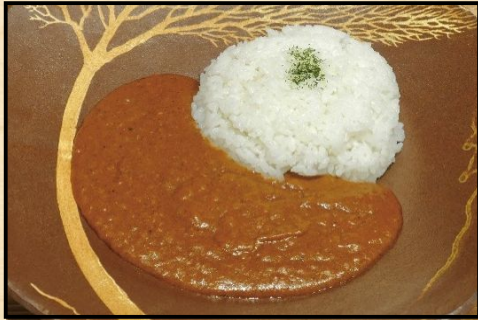
オリジナルカレー