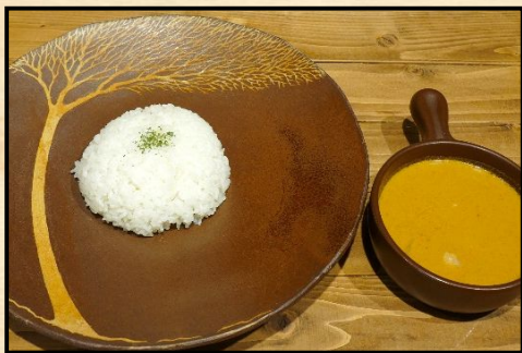
マッサマンカレー

世界で最も美味しい食べ物TOP50で1位に選ばれたこともあるココナッツベースのタイカレーです。辛味が少ない上品な味わいで女性やお子様にも好まれるカレーです。